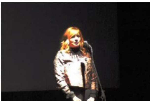
Bolnica VITA Novi Sad

Podeli na Facebooku | Twitni na twitteru | G+