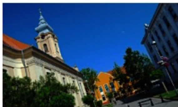
Bolnica VITA Novi Sad

Podeli na Fejsbuku Tweetni na twitteru G+