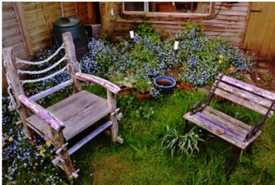
Bolnica VITA Novi Sad