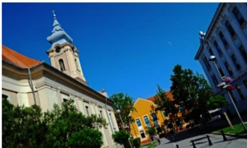
Bolnica VITA Novi Sad