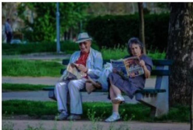
Bolnica VITA Novi Sad