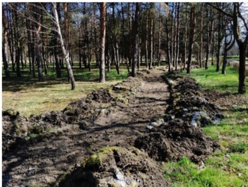
Bolnica VITA Novi Sad

f Podeli na Fejsbuku t Tvitiraj na Twitteru G+